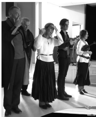
Överst till vänster: Ömsint dansande