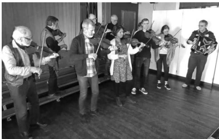
Koncentrerat spelande....